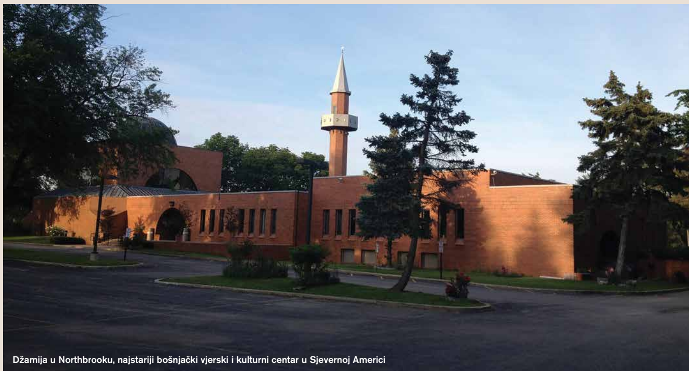
Džamija u Northbrook, najstariji bošnjački vjerski i kulturni centar u Sjevernoj Americi

Sjevernoj Americi više od šezdeset i skoro svaki je vlastitim sredstvima uspio sagraditi mesdžid ili džamiju. Sve su džamije, osim jedne koja je sagrađena osamdesetih godina u širem području Chicaga, započete i završene u posljednjih dvadesetak godina. A grade se i danas.